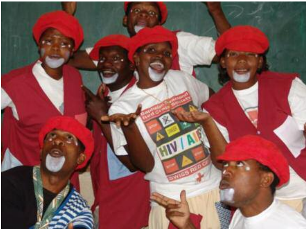
Ungewöhnliche Wege der Aufklärung: Auf spielerische Weise bringen vom Roten Kreuz ausgebildete Clowns Jugendlichen in Schulen das Thema näher.

Nebst der Begleitung im Alltag haben die Besuche auch eine wichtige Funktion für den Therapieerfolg. Patientinnen und Patienten, die nicht zur Einnahme ihrer Medikamente in der Klinik erscheinen, werden aufgesucht. So ist die Kontinuität der Therapie gewährleistet.