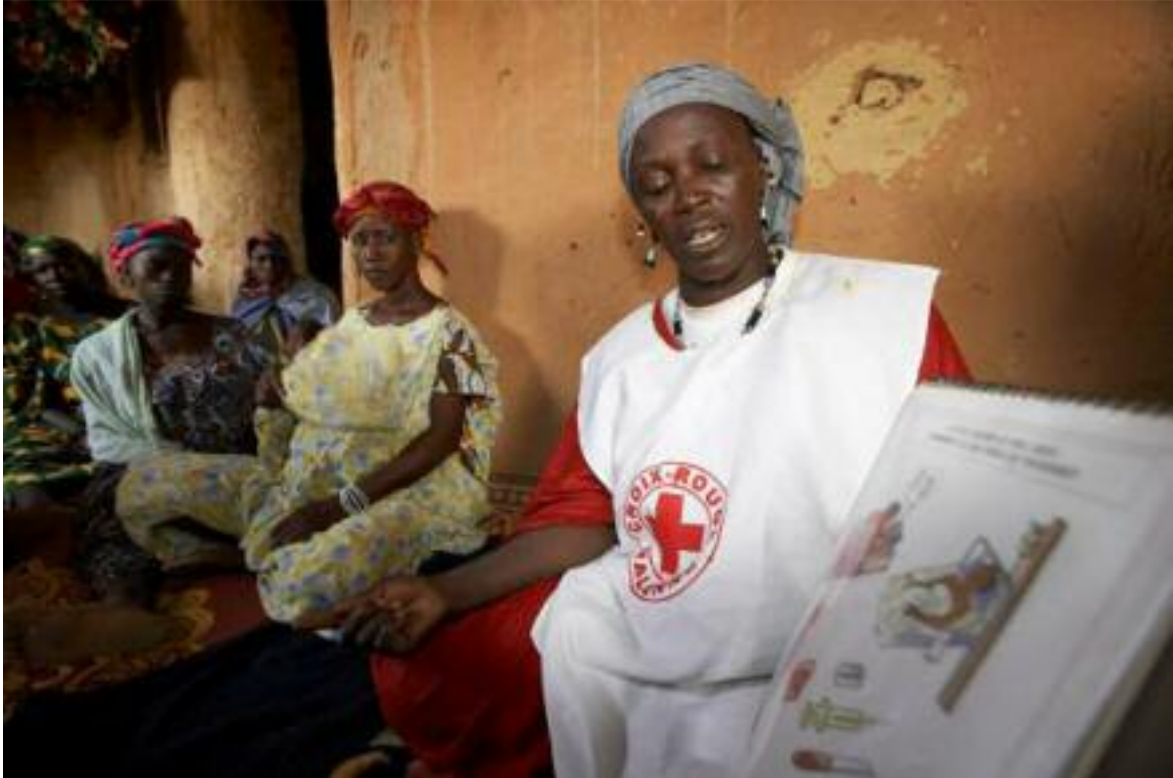
Eine Freiwillige des Malischen Roten Kreuzes zeigt einer Gruppe von Frauen, wie man sich vor Aids schützen kann. Weil viele nicht lesen können, informiert sie mit Bildern.