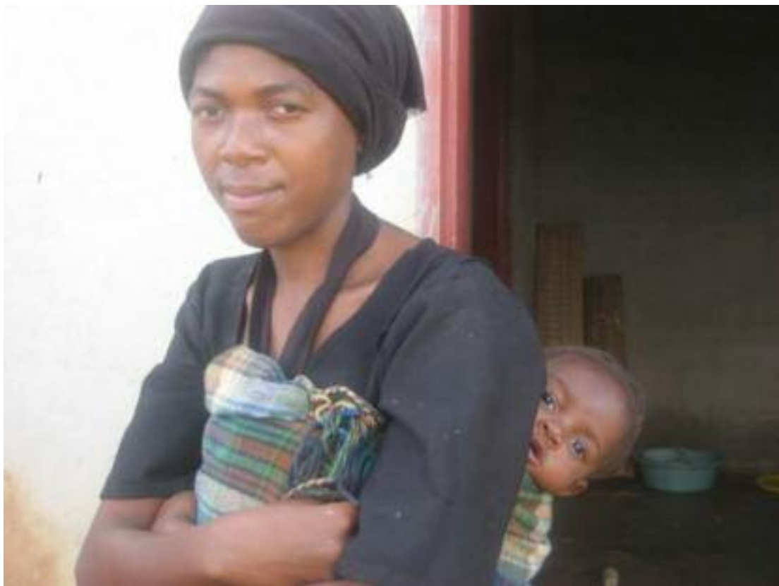
Densile aus Swasiland: Sie erhält seit mehreren Monaten vom Roten Kreuz Medikamente. Ihr Kleinstes kam deshalb gesund zur Welt.