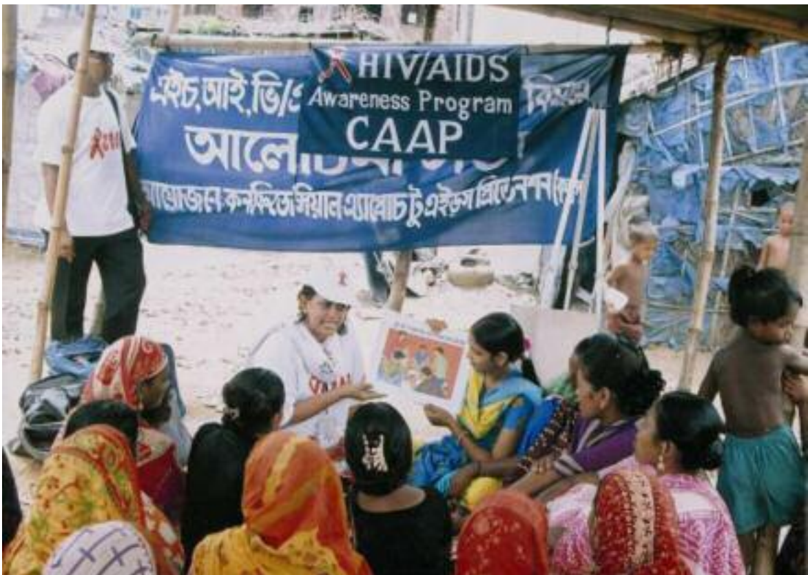
Frauen sind besonders verletzlich. Aufklärung und Information sind deshalb für sie speziell wichtig. Hier spricht eine Rotkreuz-Freiwillige in Bangladesch zu einer Frauengruppe.